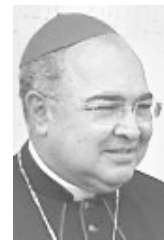
Orani João Tempesta, O.Cist. Arcebispo do Rio de Janeiro