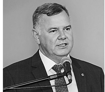
BILLY BOSS/CÂMARA DOS DEPUTADOS

afirma que a implementação do free flow teria "exposto deficiências de informação aos usuários, além de falta de padronização entre concessionárias e relatos de falhas de identificação automática de veículos e de classificação de categoria", o que poderia gerar cobranças indevidas.