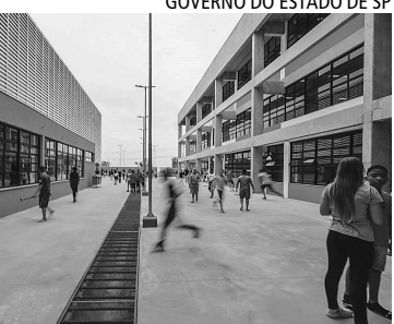
GOVERNO DO ESTADO DE SP

"Precisamos desenvolver algumas competências se quisermos ver os alunos vencendo lá na frente. O mercado vai cobrar a habilidade de comunicação em português e em outros idiomas, a habilidade de resolver problemas e a habilidade de relacionamento interpessoal. Para criarmos isso, precisamos ter a infraestrutura, com uma escola de alto nível, com espaço de inovação, quadra poliesportiva coberta e sala de leitura para atividades complementares. E a iniciativa privada vai cuidar da zeladoria e da segurança, enquanto