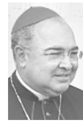
Orani João Tempesta, O.Cist Arcebispo do Rio de Janeiro