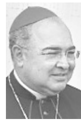
Orani João Tempesta, O.Cist. Arcebispo do Rio de Janeiro