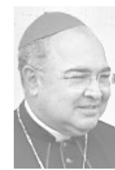
Orani João Tempesta, O.Cist. Arcebispo do Rio de Janeiro